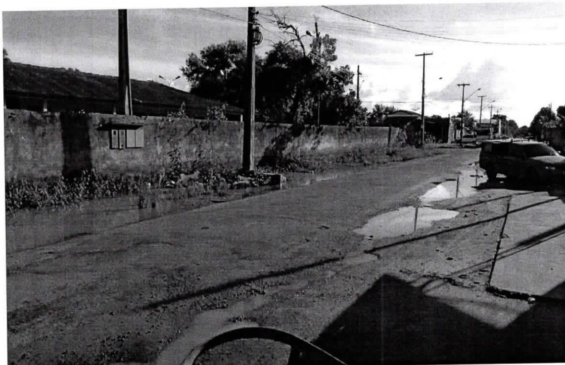
Plenário Estácio de Melo: Boa Vista, RR 02 de julho de 2019.

Os Moradores do Bairro Tancredo Neves, por inúmeras vezes solicitaram melhorias para a rua: Leôncio Barbosa e nada foi feito até o presente momento. Solicito que seja realizado a regularização da pavimentação asfáltica, drenagem e calçadas desta rua. Portanto esse pedido se prende ao fato de proporcionar uma qualidade de vida melhor, para a comunidade daquela localidade. Diante o exposto solicito a Prefeitura Municipal de Boa Vista, uma análise imediata com urgência para o atendimento desta indicação.