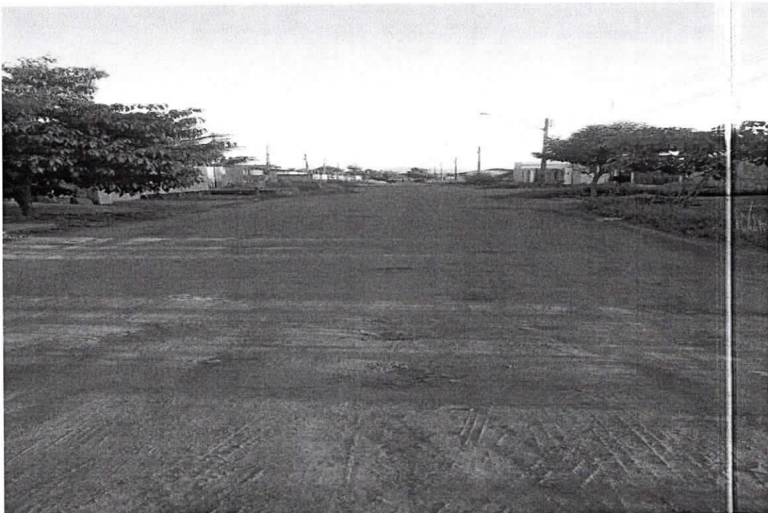
Plenário Estácio de Melo: Boa Vista, RR 07 de agosto de 2019.

Os Moradores do Bairro Cidade Satélite, por inúmeras vezes solicitaram melhorias para a Rua: Faculdade Atual da Amazônia e nada foi feito até o presente momento. Solicito que seja realizado a regularização da pavimentação asfáltica, drenagem e calçadas desta rua. Portanto esse pedido se prende ao fato de proporcionar uma qualidade de vida melhor, para a comunidade daquela localidade. Diante o exposto solicito a Prefeitura Municipal de Boa Vista, uma análise imediata com urgência para o atendimento desta indicação.