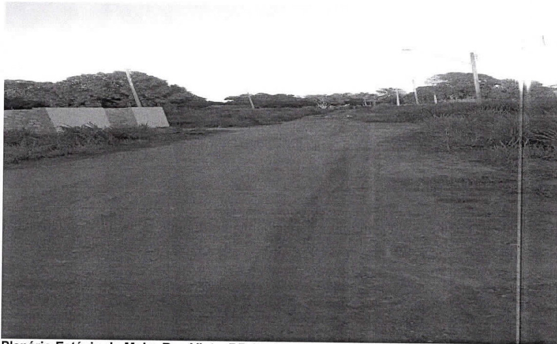
Plenário Estácio de Melo: Boa Vista, RR 07 de agosto de 2019.

Os Moradores do Bairro Cidade Satélite, por inúmeras vezes solicitaram melhorias para a Rua: Unip e nada foi feito até o presente momento. Solicito que seja realizado a regularização da pavimentação asfáltica, drenagem e calçadas desta rua. Portanto esse pedido se prende ao fato de proporcionar uma qualidade de vida melhor, para a comunidade daquela localidade. Diante o exposto solicito a Prefeitura Municipal de Boa Vista, uma análise imediata com urgência para o atendimento desta indicação.