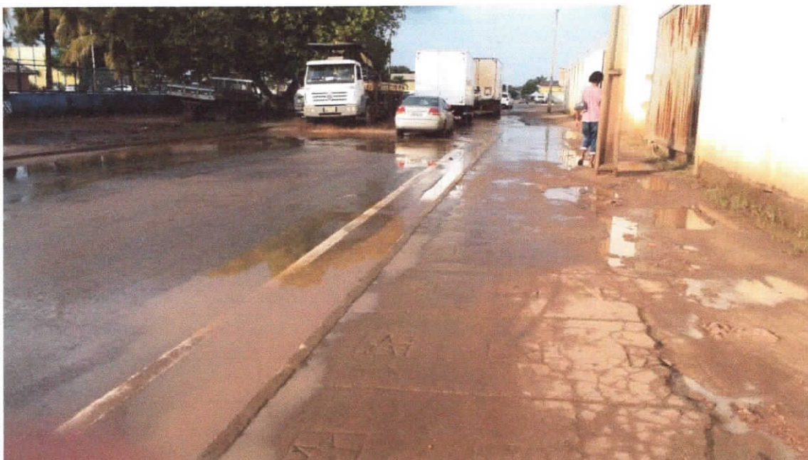
rua Deco Fonteles