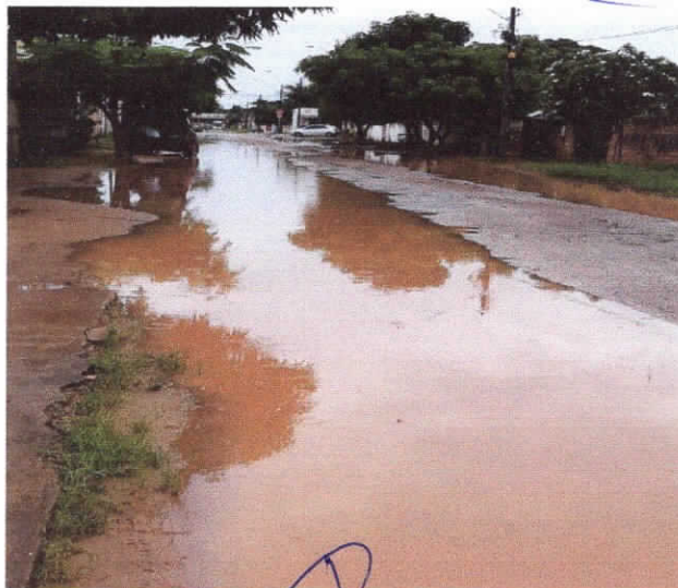
rua Amâncio Ferreira de Lucena