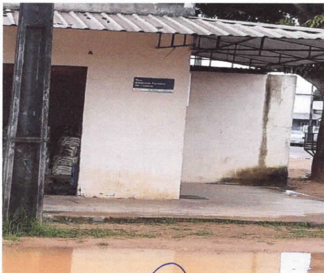
rua Amâncio Ferreira de Lucena