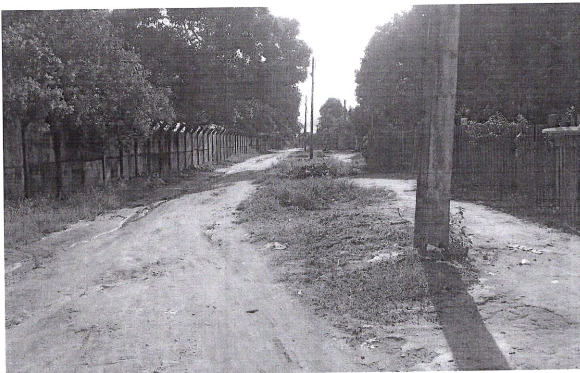
Plenário Estácio de Melo: Boa Vista, RR 04 de dezembro de 2019.

Os Moradores do Bairro São Bento, por inúmeras vezes solicitaram melhorias para a Rua: Da Lagoa e nada foi feito até o presente momento. Solicito que seja realizado a regularização da pavimentação asfáltica, drenagem e calçadas desta rua. Portanto esse pedido se prende ao fato de proporcionar uma qualidade de vida melhor, para a comunidade daquela localidade. Diante o exposto solicito a Prefeitura Municipal de Boa Vista, uma análise imediata com urgência para o atendimento desta indicação.