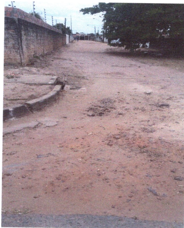
Rua Tia Joaca, Caímbé